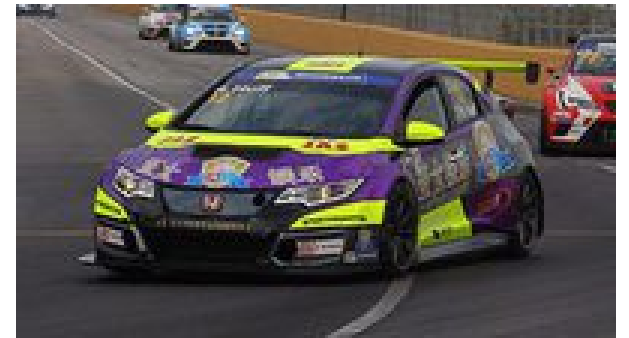
Directo: Sesión clasificatoria de las TCR en Macao