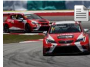
Pepe Oriola el más rápido en el arranque de las TCR Series