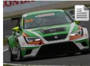
Jordi Oriola se une al Campos Racing en las TCR Series