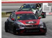
Ferenc Ficzka el más rápido de los segundos libres