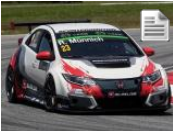
Pole para Kevin Gleason en las TCR Series