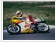
Talento natural para la carrera Legends 250cc: Si se trata de hablar de pilotos con un don innato para hacer...