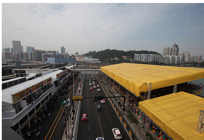
2013 Macau Grand Prix Circuit Guia 13-17th November, 2013

16 de noviembre de 2015 by Redacción ( http://www.vlcnoticias.com/autor/redaccion/ ) No Comments