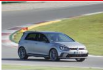
Volkswagen Golf GTI Clubsport