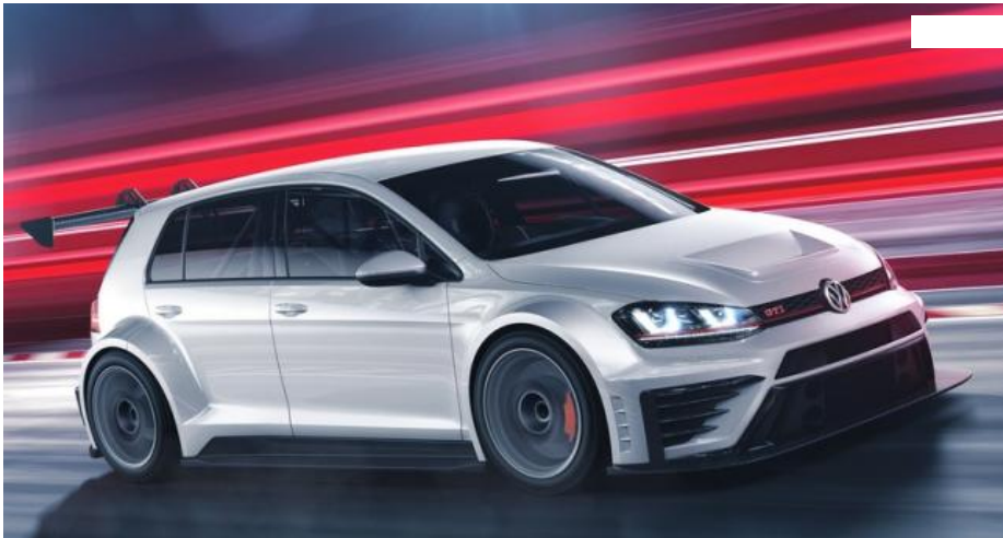
Volkswagen Golf GTI TCR: el GTI más radical y destinado a la competición

La marca alemana ha hecho oficial el coche con el que competirá en el Touring Racer International Series (TCR). Esta edición 'extrema' del Golf GTI presta una potencia de 330 CV y solo tendrá 20 unidades, todas ellas destinadas a equipos privados de competición.