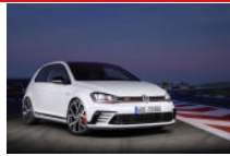
Volkswagen Golf GTI Clubsport