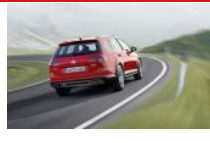
Nuevo Volkswagen Golf Alltrack