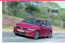
Volkswagen Golf Sportsvan 2.0 TDI