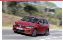
Volkswagen Golf Sportsvan

autofácil.es » Marcas y modelos de coches » Volkswagen » Golf