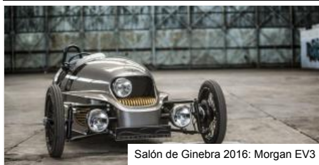
Salón de Ginebra 2016: Morgan EV3

Salón de Ginebra 2016: Citroën e-Méhari Courreges Concept Citroën presentará en el Salón de