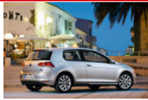
Volkswagen Golf VII