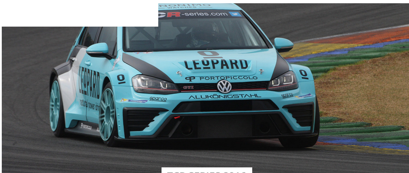
TCR SERIES 2016