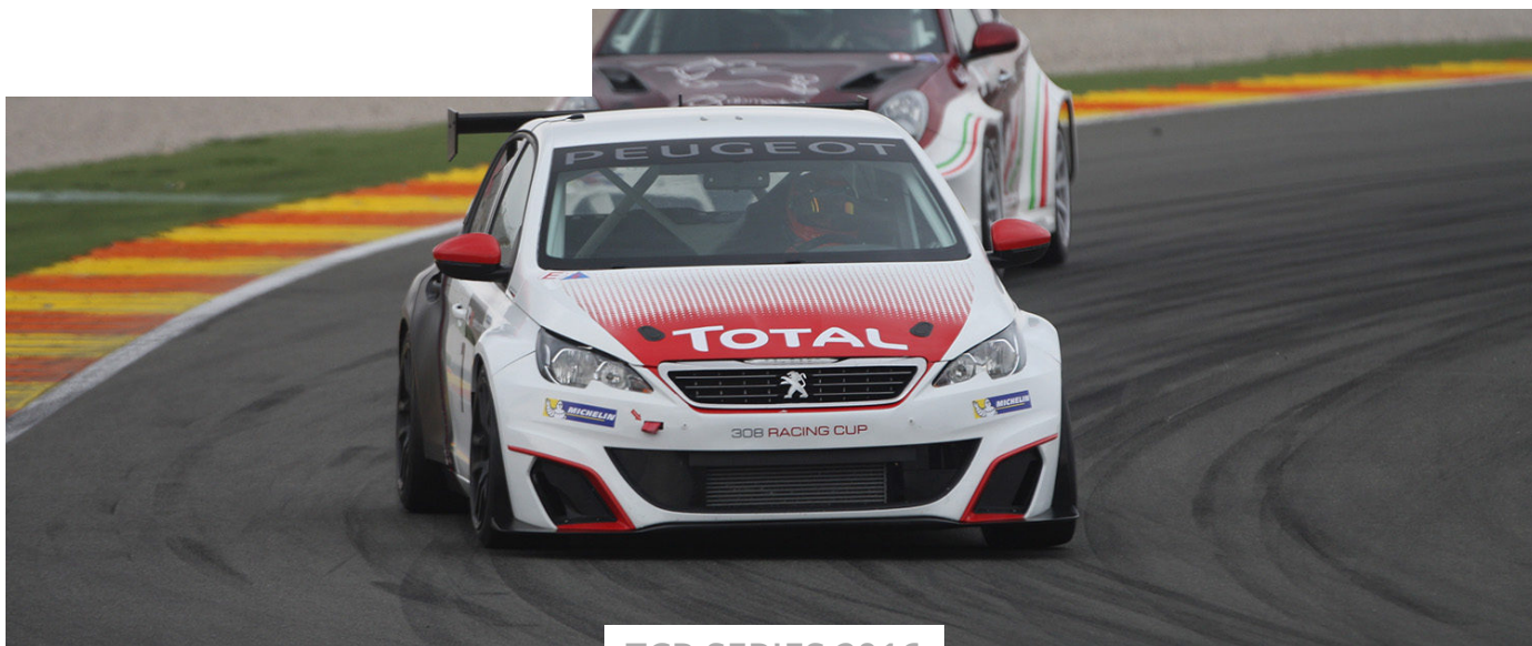
TCR SERIES 2016