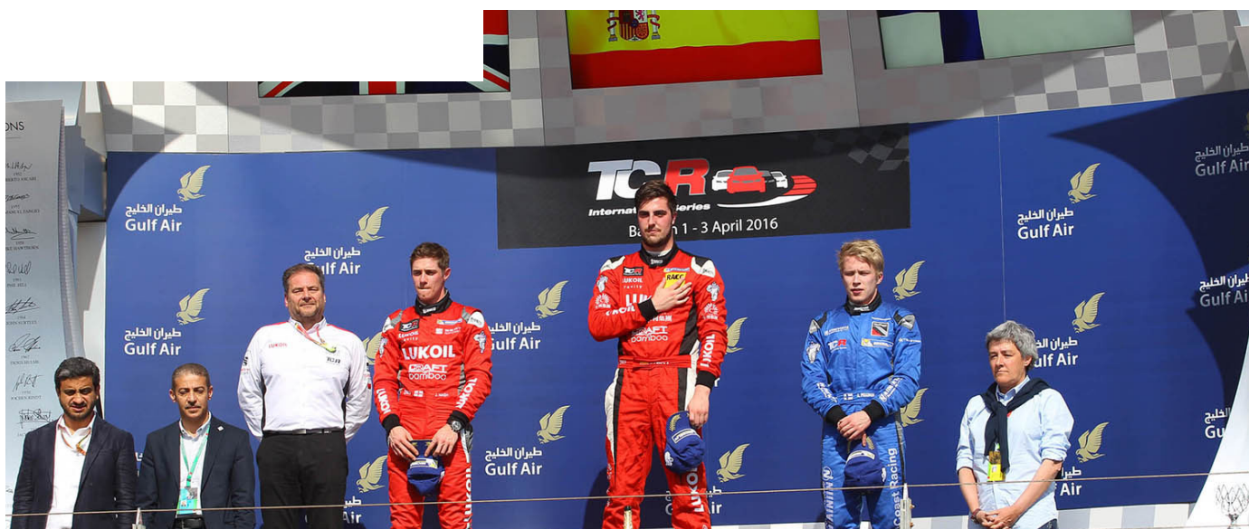
TCR SERIES 2016